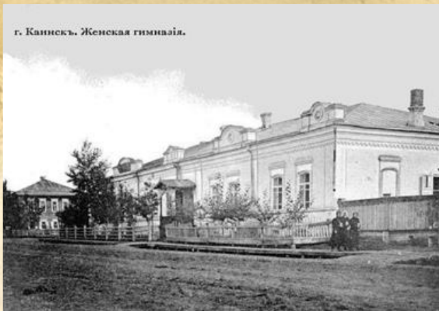
Кайниск. Женская гимназия. 1903 год