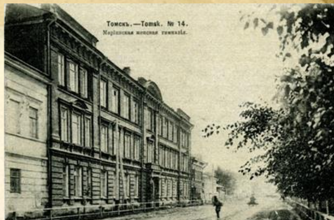
Томск. Мариинская женская гимназия