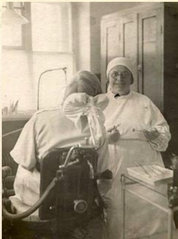
Новосибирск. Амбулатория завода № 153, 1938 г.